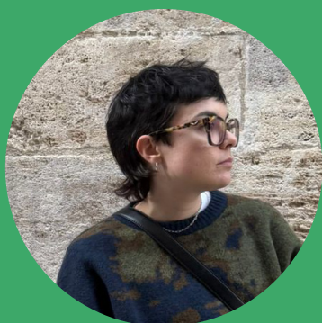
Carla Serrano @la.inercia